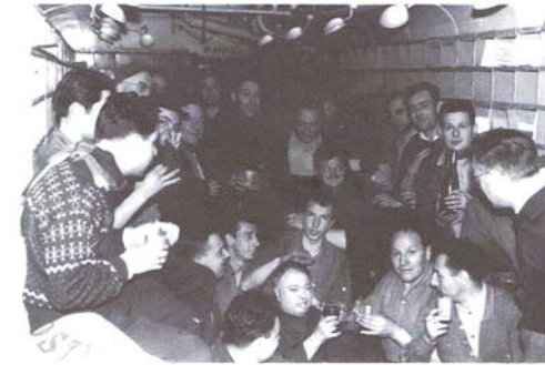
L'Ambulant..... « Une micro société » repliée sur elle-même le temps du voyage