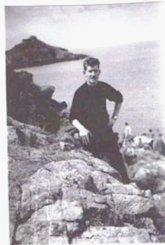
L' Auteur en 1957.